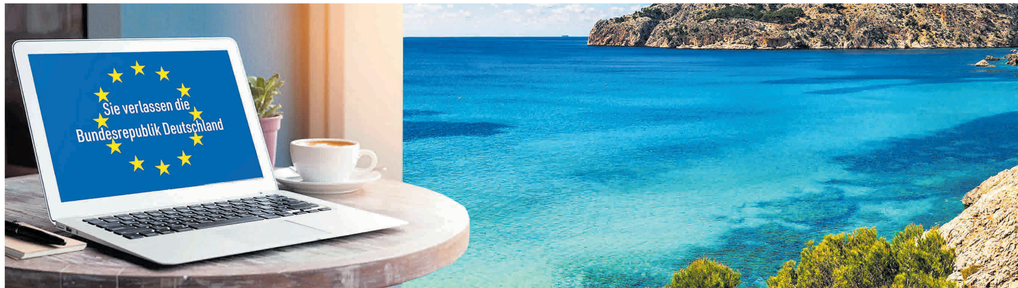
Für immer mehr Menschen ist eine physische Anwesenheit an einem realen Arbeitsplatz mit Schreibtisch in Deutschland nicht mehr notwendig. Doch im mediterranen Lebens- und Arbeitsumfeld geraten fiskalische Regelungen und Fallstricke des Zuzugslands leicht aus dem Blickfeld.

Um also zu verhindern, dass die Auswanderung zu einem „fiskalischen Großschadensereignis“ führt, haben sich die beiden führenden Steuerexperten zu einem gemeinsamen Projekt zusammengetan, bei dem sich nun die beiden Perspektiven ideal ergänzen sollen. Dabei geht es darum, die sehr